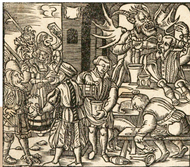
Friderich Matthäus «Wider den Sauffteufel» Titelblatt Ausgabe 1557

Was muss man wissen, um es zu verstehen?