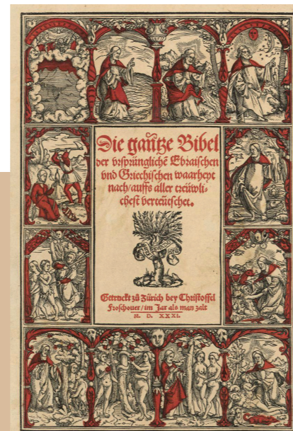
Titelblatt Die ganze Bibel gedruckt bei Froschauer Zürich, 1531.

Gutenberg druckte zwischen 1452 und 1454 die erste Bibel. In Basel entstand 1468 die erste in der Schweiz gedruckte Bibel. Von den weltweit ca. 120 Inkunabeln entstanden 19 in Basel. 1524 druckte Christoph Froschauer «das Buch» in Zürich. Weitere Kantone kamen hinzu. Die kleine Schweiz war ausserordentlich produktiv im Bibel-Druck zwischen 1468 und 1800. Der Referent zeigt Beispiele aus der umfangreichen Sammlung des Referenten, untermalt mit Anekdoten.