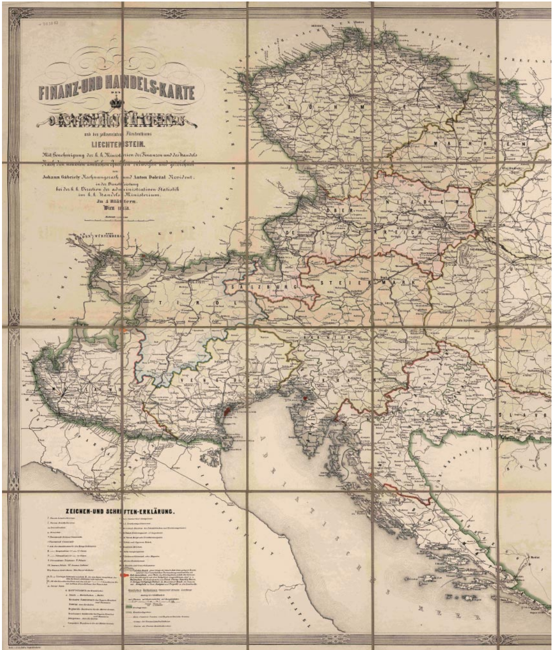
Johann Gábrly, Finanz- und Handelskarte des Oesterreichischen und des zollvereinigten Fürstenthums Liechtenstein, Wien 1858 (Ausschnitt).