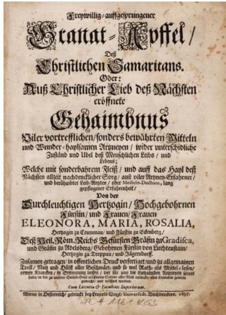
Eleonora Maria Rosalia von Liechtenstein, Freywillig-auffgesprungener Granat-Appfel Dess Christlichen Samaritans, Wien 1695, Titelblatt.

die beiden nachher in Kontakt, aber die Enttäuschung Celans war offensichtlich. Daher ist der Inhalt des Gedichts «Todtnauberg» das Wichtigste;